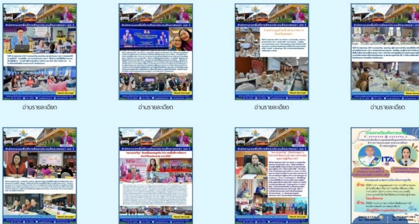
อำนาจละเอียด