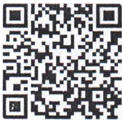
แบบลงทะเบียน

จึงเรียนมาเพื่อโปรดประชาสัมพันธ์งานดังกล่าวให้กับผู้สำเร็จการศึกษาด้วยทุน พสวท. ทราบต่อไปด้วย สสวท. ขอขอบคุณมา ณ โอกาสนี้