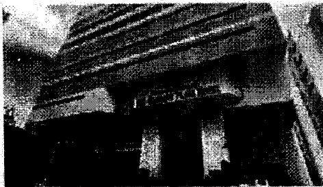
แผนที่ โรงแรม