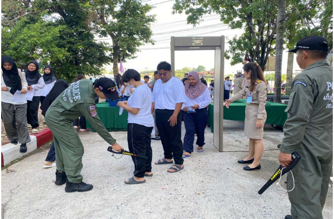
คณะกรรมการตรวจค้นประจำสนามสอบ ตรวจค้นผู้เข้าสอบ เพื่อป้องกันการทุจริต