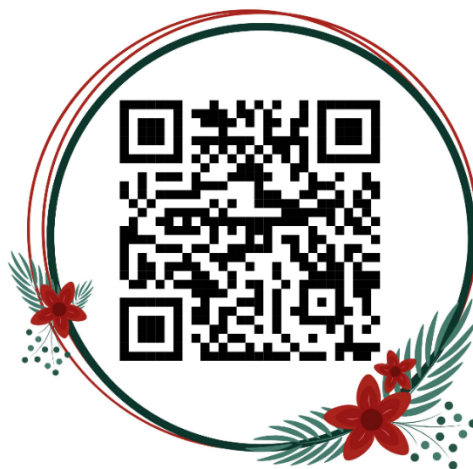
แผนปฏิบัติการประจำปีงบประมาณ พ.ศ. ๒๕๖๗